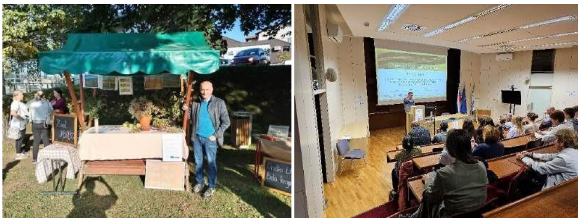
Predstavitve projekta in doseženih rezultatov na Dnevh zeliščarstva v Beli krajini, Črnomelj (levo) in Gozdarskem inštitutu Slovenije (desno).

Izvedli smo serijo usposabljanj, delavnic in javnih predstavitev projekta za člane kmetijskih gospodarstev in širšo javnost, z namenom povečevanja zavedanja in krepitev znanja o vzpostavljanju in ohranjanju mejic. Predstavitve so vključevale več tem, vključno z vključevanjem kmetijskih gospodarstev v urejanje in vzdrževanje mejic, spodbujanjem trajnostnega upravljanja, varovanjem tal in ohranjanjem biotske raznolikosti. Udeleženci so se seznanili z različnimi pristopi in tehnikami urejanja mejic, izbiro rastlinskih vrst, vzdrževanjem habitatov za koristne organizme, metodami za preprečevanje erozije in ohranjanje tal ter trajnostnimi praksami kmetovanja. Predstavili smo tudi uspešne primere sodelovanja kmetijskih gospodarstev v projektu, izbrane vrste za vzpostavitev ali obnovo mejic in njihov vpliv na biodiverzitetu, ekosistemske storitve in koristi za kmetijska gospodarstva.