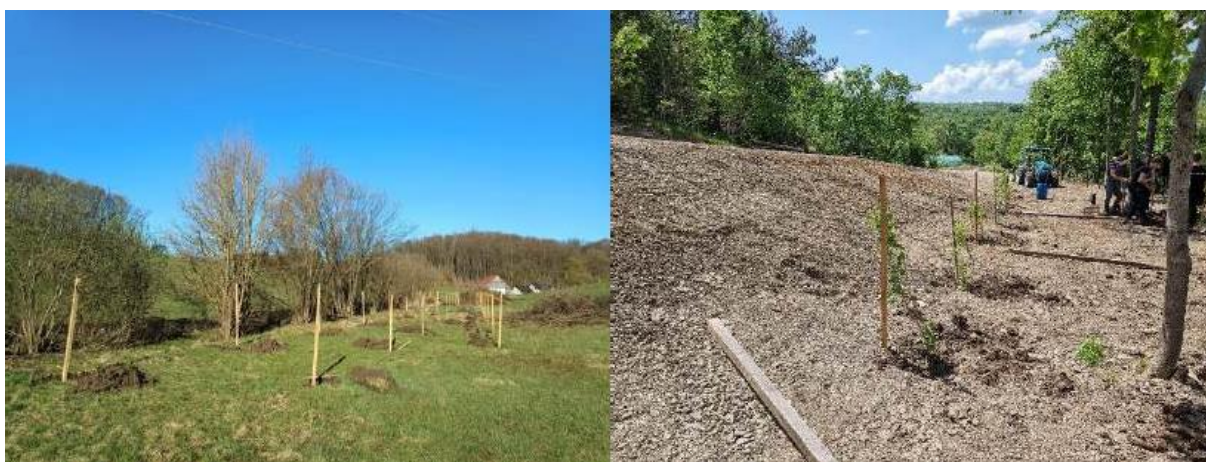
Delo na terenu – količenje in sadnja mejic z uporabo mikoriziranih in ciljno izbranih drevesnih in grmovnih vrst in sort, kot nosilnih elementov mejic z mnogoterimi ekosistemskimi storitvami (KG Vertovšek in KG Andrejevi).

S projektom smo dokazali, da lahko mejice ponovno pridobijo svoje mesto v kmetijski krajini, ne le kot elementi biodiverzitete, temveč kot pomemben ekonomski vir za kmete, obenem pa smo obudili in spodbudili sodelovanje kmetov z raziskovalnimi in svetovalnimi inštitucijami. Ta pristop, ne samo da prispeva k ohranjanju biotske raznovrstnosti, ampak dolgoročno povečuje ekonomsko varnost kmetijskih gospodarstev in spodbuja sonaravno gospodarjenje, kar kaže na velik potencial mejic za trajnostni razvoj slovenskega podeželja.