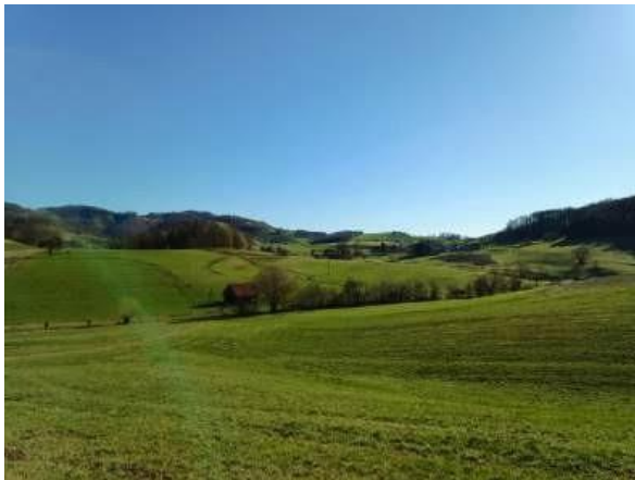
Primer mejice pred urejanjem (KG Vertovšek).

v letošnjem letu, maja 2024, zaključujemo triletni projekt Mejice kot podpora biotski raznolikosti, ohranjanju tradicionalnega in izginjajočega kulturnega vzorca slovenskega podeželja ter zagotavljanju ekosistemskih storitev - EIP 16.5 Mejice . V ospredju projekta je bilo ozaveščanje in usposabljanje vpletenih, posebej kmetij ter strokovne in širše javnosti, o pomenu in načinih vzpostavitve ter vzdrževanja mejic. Mejice so bistven element kulturne in kmetijske krajine, ki zagotavljajo ter bistveno in pozitivno vplivajo na izboljšanje biotske raznovrstnosti in številne ekosistemske storitve.