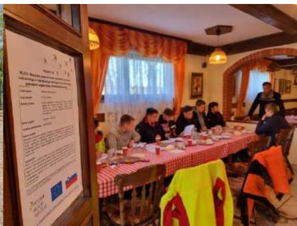
Prenos znanja v prakso za dijake SGLŽŠ Postojna na KG Andrejevi (levo) in KG Vertovšek (desno).