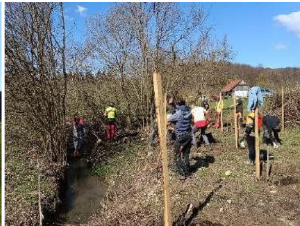
Delo na terenu – urejanje mejice ob vodotoku in količenje za dosadnjo ciljnih vrst in sort (KG Vertovšek).