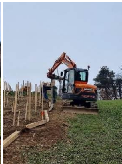
Priprava terena za vzpostavitev mejice na KG Grčman (levo) in KG Zaplana (desno).

Na vsakem kmetijskem gospodarstvu smo z lastniki v individualnih razgovorih obravnavali izzive in razvojne možnosti, ki jih mejice lahko prinesejo v njihova specifična okolja. Lastnike smo vodili v izvajanju ukrepov za pravilno odstranjevanje in zatiranje tujerodnih ter invazivnih vrst. Prav tako smo zabeležili začetno stanje obstoječih in bodočih mejic za lažje načrtovanje in ocenjevanje učinkovitosti našega dela.