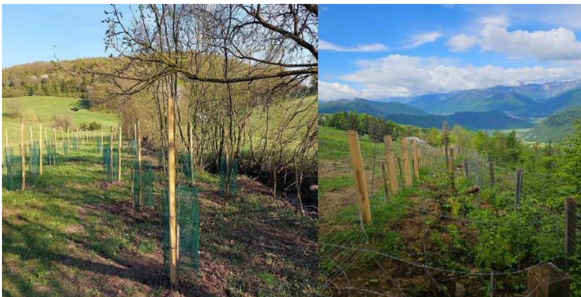
Vzpostavljeni in pred divjadjo zaščiteni mejici na KG Vertovšek, Veliki Kamen (levo) in KG Široko Tolminski Lom (desno).

Mejice smo v projektu zasadili ali obnovili na šestih lokacijah, ki se med seboj bistveno razlikujejo po klimatskih razmerah in lastnostih tal . Pri izbiri rastlinskih vrst smo izhajali iz lokalnega okolja kjer izbrane vrste že samorodno dobro uspevajo, ter jih dopolnili z izbranimi sortami ali vrstami, prilagojenimi na prihajajoče klimatske razmere. Pri izboru vrst in sort smo vedno tesno sodelovali z lastniki oziroma upravljalci kmetij in upoštevali njihove želje oziroma potrebe glede na gospodarske usmeritve kmetij. Pri izbiri sadnih vrst in sort smo upoštevali tudi kriterij odpornosti na bolezni in pričakovano minimalno oskrbo. Skupno je bilo na šestih kmetijah posajenih več kot 720 rastlin , med njimi bezeg, breza, češnja, črni ribez, dren, glog, jabolana, jerebika, kostanj, leska, robida, skorš, sliva, sončnica in šipek. Vse sadike leske in breze smo mikorizirali (okužili) z v Sloveniji avtohtono in široko prisotno tržno vrsto poletne gomoljike ( Tuber aestivum / uncinatum ). Po sajenju so kmetije poskrbele za individualno ali skupinsko zaščito pred divjadjo .